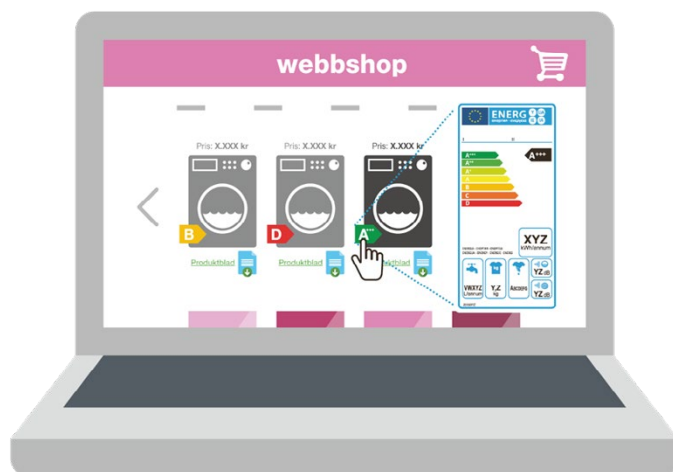
Figur 2. Energimärkning och produktblad i webbutik.

Det finns krav på att energimärkning och produktblad ska visas vid försäljning på internet. Kraven gäller sedan den 1 januari 2015 och förra årets kontroll visade att många butiker inte visade energimärkningen.