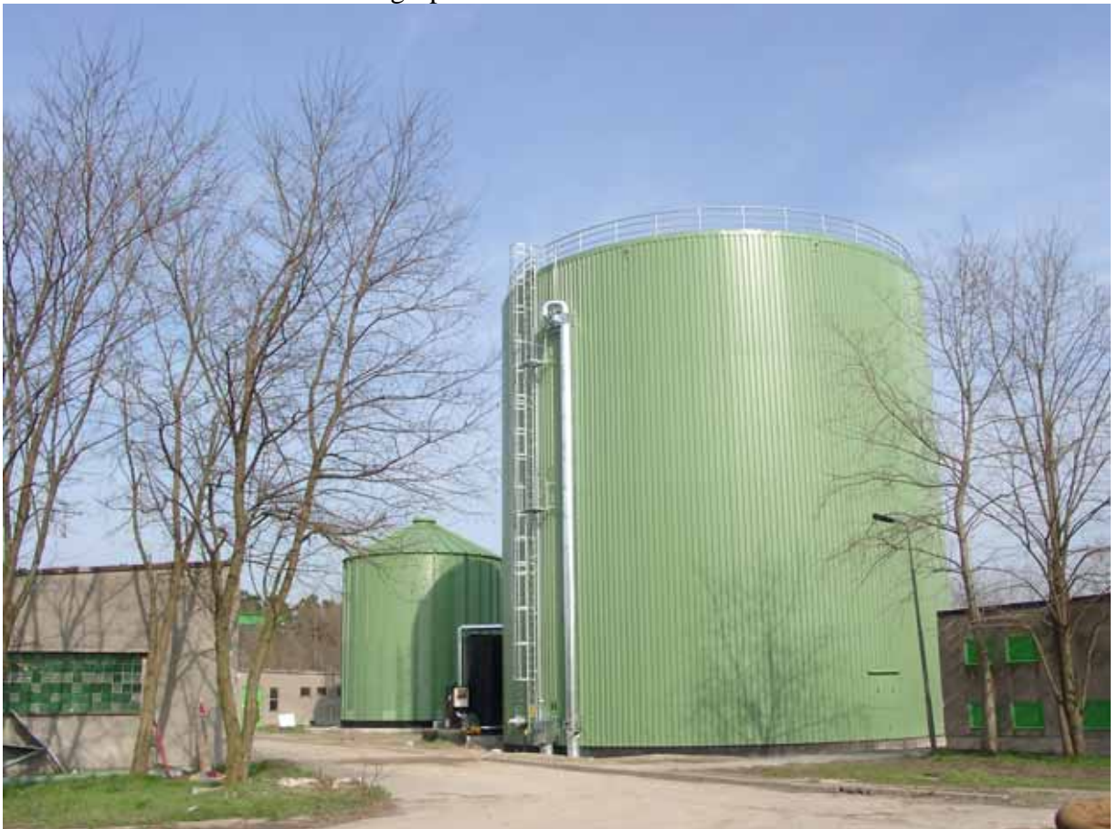
Bild 1 Rötkammaren är biogasanläggningens hjärta och består vanligtvis av en cylindrisk behållare av stål eller betong. Rötkammaren är isolerad och försedd med en omrörare för att kunna åstadkomma goda förhållanden för biogasproduktionen.

På deponier bildas biogas spontant så länge nedbrytningen av det organiska materialet fortgår. Deponering av organiskt material förbjöds 1 januari 2005 varför mängden biogas från deponi förväntas minska i framtiden. Genom att ta tillvara deponigasen bromsar man ökningen av växthuseffekten på två fronter. Dels tar man tillvara metanet som är en 20 gånger starkare växthusgas än koldioxid, dels genererar man energi som i bästa fall ersätter fossil dito. Vid uttaget av deponigas sker ett visst inläckage av luft, vilket i praktiken omöjliggör uppgradering av deponigas till fordonsgaskvalitet. Därför används deponigas till värme eller el-konvertering.