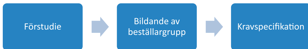
Figur 1. Processbild för arbete enligt process "teknikupphandlingsmodellen".

Arbetet har bedrivits enligt två huvudsakliga processer. Den ena processen bygger på teknikupphandling, som Energimyndigheten har lång erfarenhet av. Denna metod förutsätter att en beställargrupp etableras. Den andra processen är mer generell för upphandling av innovation och kan användas både av enskilda myndigheter samt grupper av beställare.