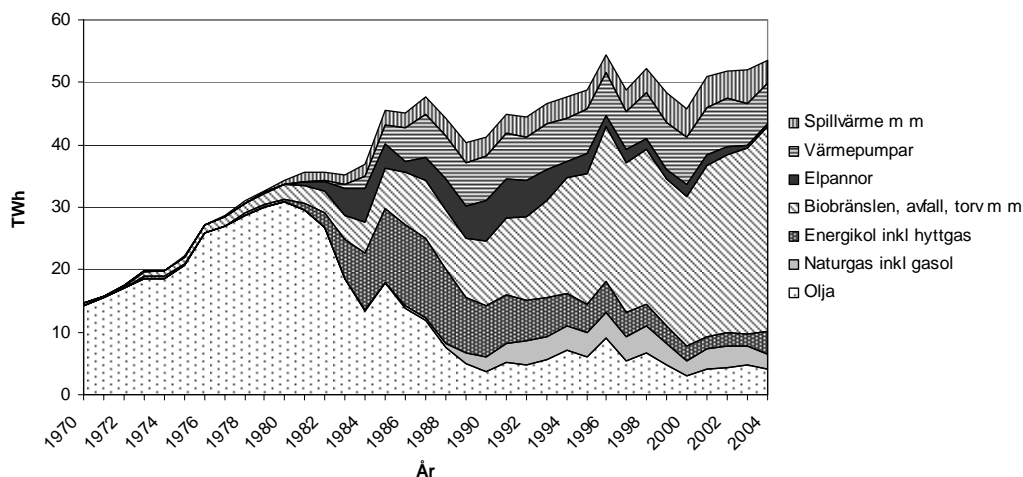
Figur 1. Tillförd energi i fjärrvärme 1970-2004. Källa: Energimyndigheten (2005).

värmeunderlag. För det andra bolaget är den viktigaste bränslen biobränsle, följt av torv och kol i den lönsamhetsordningen. Bränsleanvändningens utveckling för hela den svenska fjärrvärmesektorn framgår från Figur 1. De lokala avvikelserna till trots följer utvecklingen även i de intervjuade företagen i stora drag den generella utvecklingen.